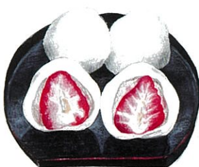
※いちご大福は2月~4月

新鮮でおいしい地元の野菜直売所 ☎野菜直売所 ☎0866-42-2612 ☎8:30~17:15 ☎月曜日・12月31日~1月5日 ☎あり ☎美術館から車で約4分