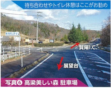
写真⑥ 高梁美しい森 駐車場