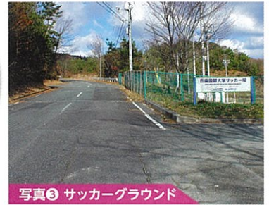
写真③ サッカーグラウンド

サルに注意!! この周辺にはサルが出ますので、以下のことに注意ください。 ・サルに食べ物を与えないでください。 ・石や棒などおどさないでください。 ・目と目が合っても睨みつけたりしないでください。 ・サルが近づいてきても、相手にしないでください。 ・手荷物などをしっかり抱えてください。 ・車の窓は閉めて駐車してください。 高梁市教育委員会