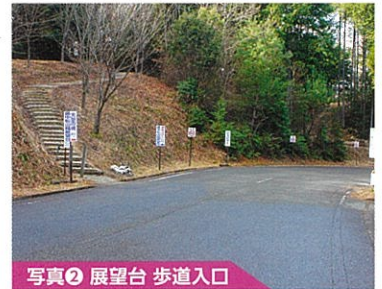
写真② 展望台 歩道入口