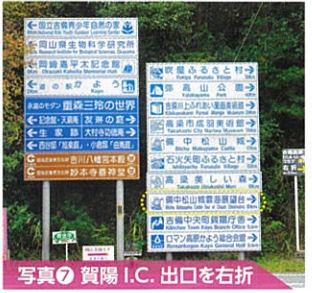
写真⑦ 賀陽I.C. 出口を右折

注意 ● 備中松山城を望む展望台周辺で野生猿(国指定天然記念物)と遭遇する可能性がありますので、野生猿を興奮させないように、落ち着いて対処してください。 ● 12月から2月末まで雪が積もることがありますのでご注意ください。 ● ゴミ等は必ずお持ち帰りください。